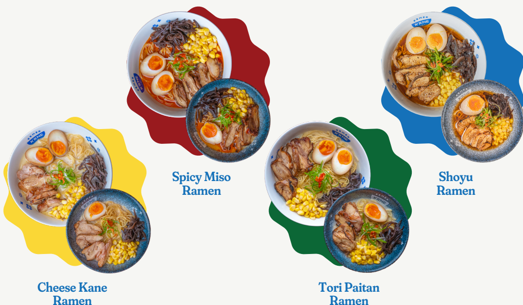
Cheese Kane Ramen

Original ramen dengan kuah shoyu khas kane dipadu dengan topping chasu chicken, ajitama, jagung dan juga jamur.