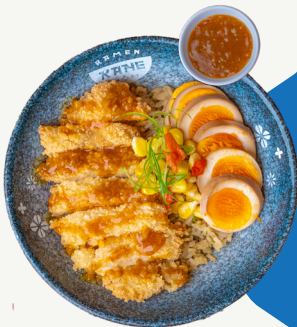
Nasi Kane Katsu with Curry Sauce