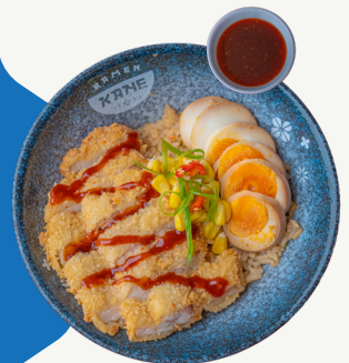
Nasi Kane Katsu with Korean Spicy Sauce