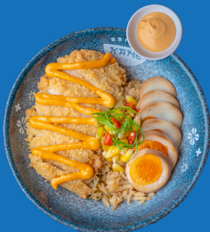
Nasi Kane Katsu with Mentai Sauce